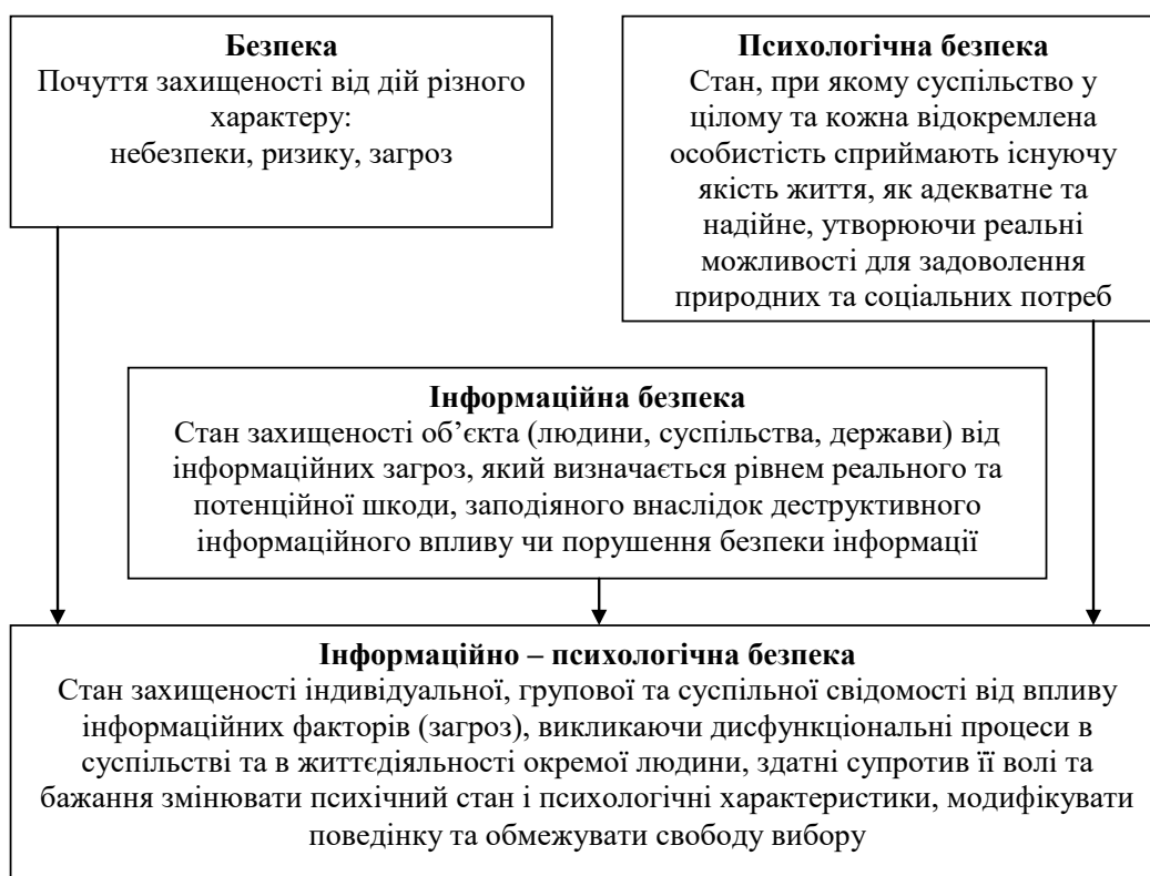
Рис. 1. Інформаційно-психологічна безпека людини

Відомо, що інформаційні стресори індивідуального або загального характеру впливають на виникнення психоемоційного перенапруження,